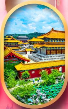
เมืองจำลองสามก๊ก