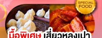
มือพิเศษ เสี้ยวหลงเป่า หมูตงพอ ซิโครงหมู เดินทาง ม.ค. - มี.ค. 69