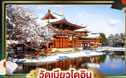
วัดบิยวดอน