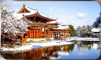
วัดเบียวโดอิน