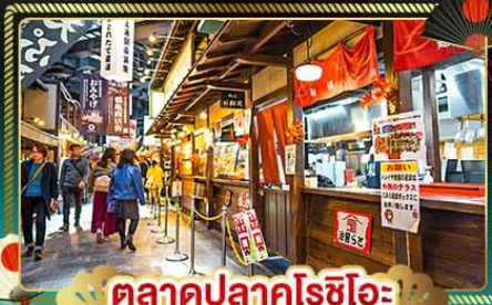
ตลาดปลาคุโรชิโอะ