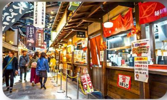
ตลาดปลาคุโรชิโอะ