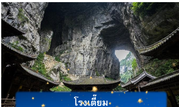
โรงเตี๊ยม

นำท่านเดินทางสู่ อุทยานแห่งชาติหลุมฟ้า สะพานสวรรค์ หรือ เทียนเชิงชานเฉียว ซึ่งถือว่าเป็นมรดกโลกทางธรรมชาติระดับ 5A ที่มีความสวยงามมากที่สุดในเมืองอู่หลง ตั้งอยู่ห่างจากเมืองอู่หลงประมาณ 18 กิโลเมตร เกิดจากการยุบตัวของเปลือกโลก ทำให้เกิดเป็นบ่อหลุมขนาดใหญ่ที่ลึกประมาณ 300-500 เมตร และมีบางส่วนเป็นโหลงทะเลลูเหมือนกับสะพานทอดข้ามระหว่างภูเขา นำท่านลง ลิฟต์แก้ว สู่หุบเหวลึก 80 เมตร ชมกลุ่มสะพานสวรรค์ – สะพานหินธรรมชาติใหญ่ที่สุดในเอเชีย 3 แห่ง ได้แก่ สะพานมังกรสวรรค์ มังกรเขียว และมังกรดำ ท่ามกลางธรรมชาติสุดอลังการ พร้อมแวะโรงเตี๊ยมโบราณฉากจริงจากภาพยนตร์ “ศึกโค่นบัลลังก์วังทอง” รวมค่าลิฟท์ 1 เที่ยว