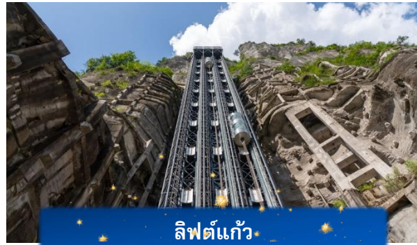
ลิฟต์แก้ว