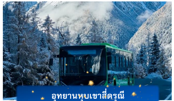
อุทยานหุบเขาสีครุณี

นำท่านเที่ยวชม หุบเขาชวงเฉียวโกว เป็นจุดวิวทิวทัศน์ที่สวยงามที่สุด ชมความงามธรรมชาติของชวงเฉียวโกว(ลำน้ำสองสะพาน) ธารน้ำมีความยาว 35 กิโลเมตร มีทิวทัศน์ของภูเขาเป็นหลัก, ลำธารผ่านจุดต่างๆที่เป็นจุดทิวทัศน์ ไม่ว่าจะเป็น ซานกัวจวง,เขาหนิวซิน, เย่เหรินเฟิง ถือเป็นจุดท่องเที่ยวแห่งหนึ่งของเขาสีครุณีที่รวบรวมจุดสำคัญหลายๆอย่างเข้าด้วยกันไว้ ชมไฮไลท์จุดชมวิว ได้แก่ ชมหุบเขาหยินหยาง ทุ่งต้นหยาง แล้วเดินทางเข้าสู่ส่วนลึกสุดท่านจะได้เห็นธารน้ำแข็ง ภูเขากระจกแก้ว ภูเขาดวงอาทิตย์ ภูเขาดวงจันทร์ ยอดเขากระต่ายทะเลสาบ และ ทุ่งหญ้าเหนียนหยูป่า (รวมรถอุทยานแล้วหิมะขึ้นอยู่กับสภาพอากาศ) หลังจากนั้นนำท่านเดินทางสู่ เมืองเม่าเสียน