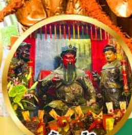
วัดกวนโก