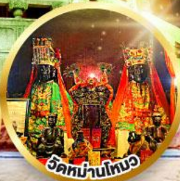
วัดม่านโหมว

ขอพรเรื่องการศึกษา, การงาน สติปัญญาและความกล้าหาญ