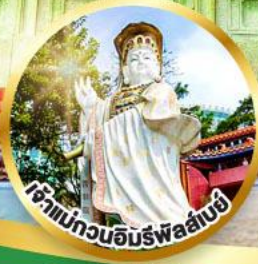
เจ้าแม่กวนอิมรัฟัลซ่าบ๋อ