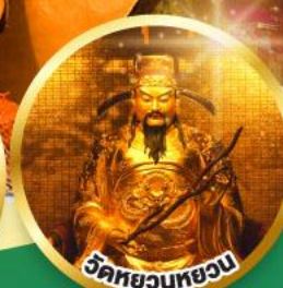
วัดหยวนหยวน

ขอพรเรื่องสุขภาพ, โชคลาภ ความเจริญก้าวหน้า