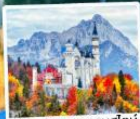
ปราสาทน้อยชวานส์ไตน์

02-08 พ.ค.69 24-30 มิ.ย.69 02-08, 16-22 ก.ย.69