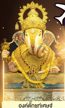
องค์ดีกษุท์เศษฐ์