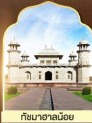
ทัชมาฮาลน้อย