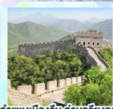
ตลาดร้อยปีเจิ้งหวิงเมี่ยว กำแพงเมืองจีน ด้านจวิ้ยกงวน