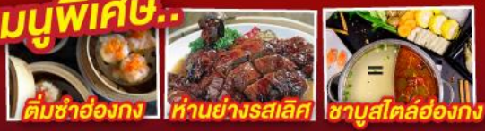
ติ่มซำฮ่องกง | ห่านย่างรสเลิศ | ซาบาสไคล์ฮ่องกง