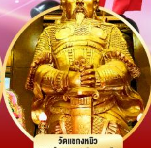
วัดแชกงหมิว ขงพรโชคลาภ การเงิน และธุรกิจ