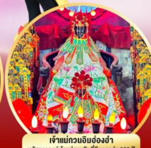
เจ้าแม่กวนอิมฮ่องฮ่า นบิสิการองค์เจ้าแม่กวนอิมที่มีอายุกว่า 600 ปี