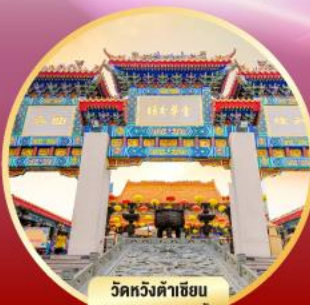
วัดหวังต้าเซียน ขงพรสุททภาพ ความรัก