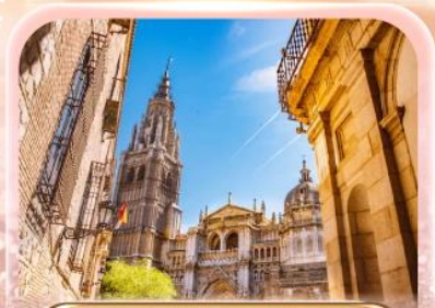
มหาวิหารแห่งโกเอลดา