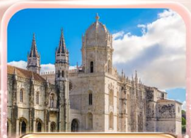
มหาวิหารจอร์นิโบ