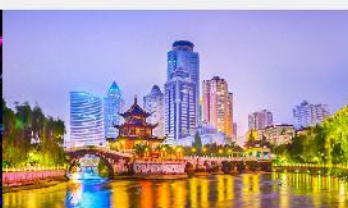
หอเจี่ยเซียวโหลว