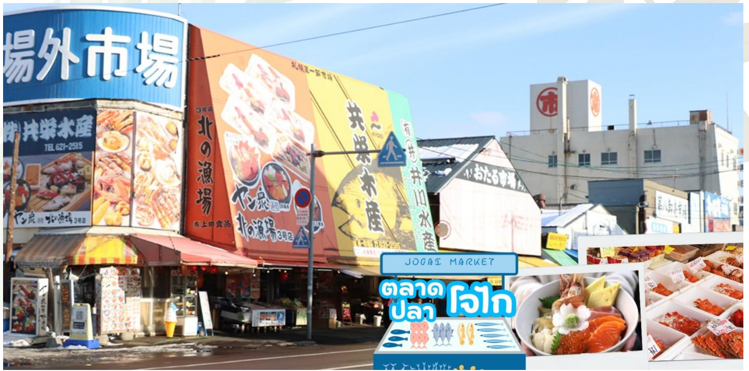
กลางวัน อีสรอาหารกลางวันตามอัยาศัย ณ ตลาดปลาโจไก