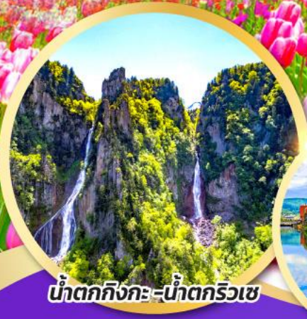
น้ำตกกิงกะ - น้ำตกริวเซ