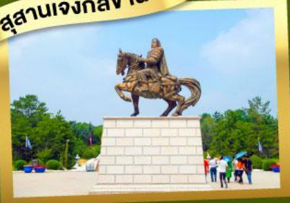
เนินทรายเสียงชาวนา