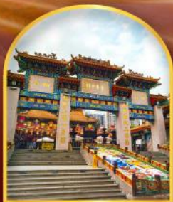
วัดหวังต้าเซียน ขอพรด้านสุขภาพ