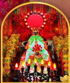
เจ้าแม่กวนอิมฮ่องฮ่า ที่มีอายุกว่า 600 ปี