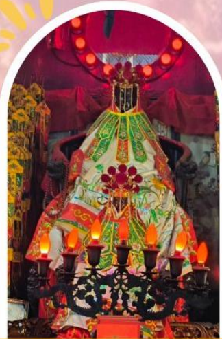
วัดเจ้าแม่กวนอิมอ่องฮำ ขอพรเรื่องเงิน ทรัพย์สิน และความมั่งคั่ง