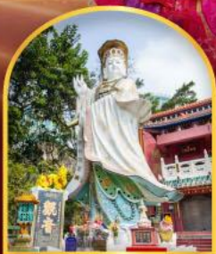
เจ้าแม่กวนอิม ธิพลิสเบย์ ขอพรเกี่ยวกับธุรกิจ และ การเงิน