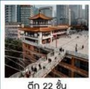
ตึก 22 ชั้น