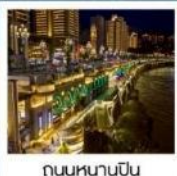
ถนนหนานปิ่น