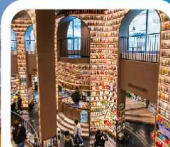
"ห้องสมุดจงซูเก๋"