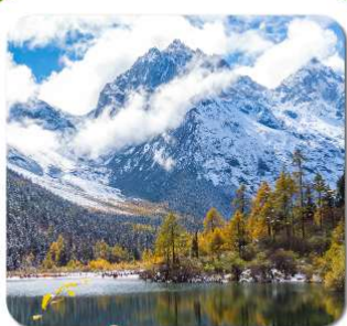
"ปี้เผิงโกว"

ชมความงาม 2 อุทยาน • สี่ดรุณี ของเฉียวโกว + ปี้เผิงโกว • พระใหญ่เล่อซาน สะพานหนานเจียว น้ำตาสีฟ้า • ห้องสมุดสุดเก๋ จงซูเก๋ • แพนด้ายักษ์บนอนเซลฟ์ ชอยกวางชอยแคบ • ถนนคนเดินชุนซีลู่ • แพนด้ายักษ์ปั้นดีก • ถนนคนเดินจินหลี่