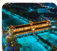
"สะพานหนานเจียว"