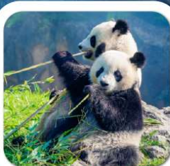
"ศูนย์หมีแพนด้า"