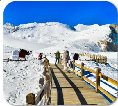
"ต่ากุกลาเซียร์"

เที่ยวชมความงาม 3 อุทยานชื่อดัง : สี้ดรุณี • ปี่เฟิงโกว ต่ากุกลาเซียร์ ชมความน่ารักของหมีแพนด้า • จัตุรัสหยางเทียนวู ชอยกว้างชอยแคบ • ถนนคนเดินซุนซีลู่ • POP MART