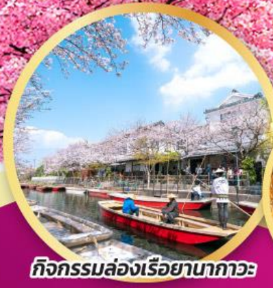
กิจกรรมล่องเรือยามากะ