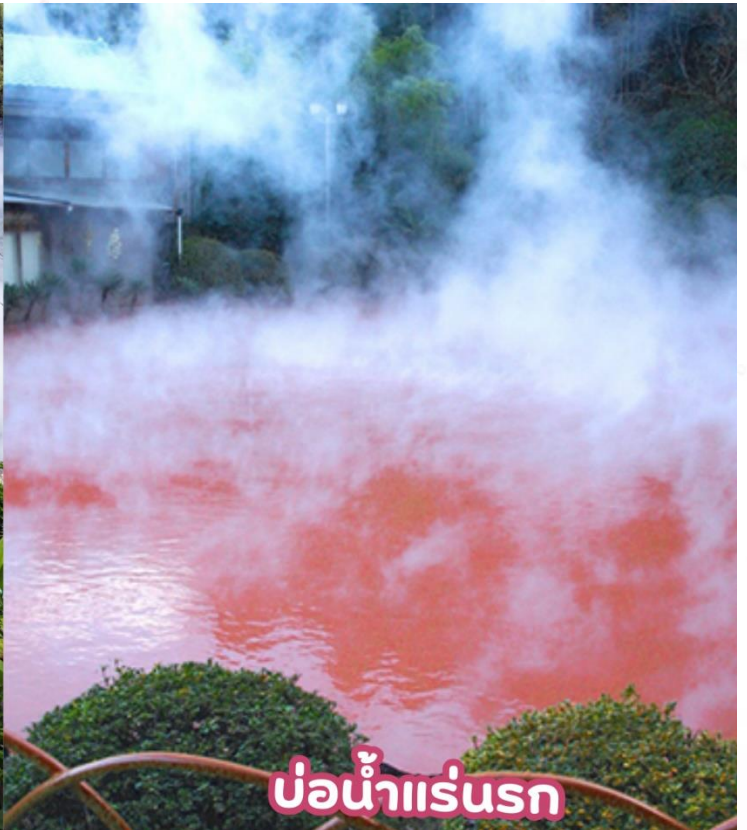
บ่อน้ำแร่นรก

ชม จิโงคุมะจิริ (JIGOKU MEGURI) ซึ่งประกอบไปด้วยบ่อน้ำแร่สีสันแปลกตาทั้งหมด 8 บ่อ (ไกด์จะพาท่านเยี่ยมชม 2 บ่อ) ที่เกิดจากการรังสรรค์ขึ้นโดยธรรมชาติแต่ละบ่อมีความร้อนสูงเกินกว่า 100 องศาเซลเซียส ด้วยสีสันและความร้อนชนิดที่มนุษย์ธรรมดาไม่อาจลงไปสัมผัสได้ จึงถูกกล่าวขานว่าเป็นเสมือน “บ่อน้ำแร่นรก” ดังนั้น ที่นี่จึงมีตัวมาสคอตเป็นยมทูตน้อยคอยให้การต้อนรับทุกคนที่มาเยือน