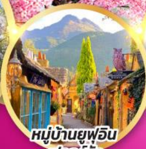
หมู่บ้านยูฟูอิน พลอร์รัล