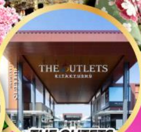
THE OUTLETS KITAKYUSHU