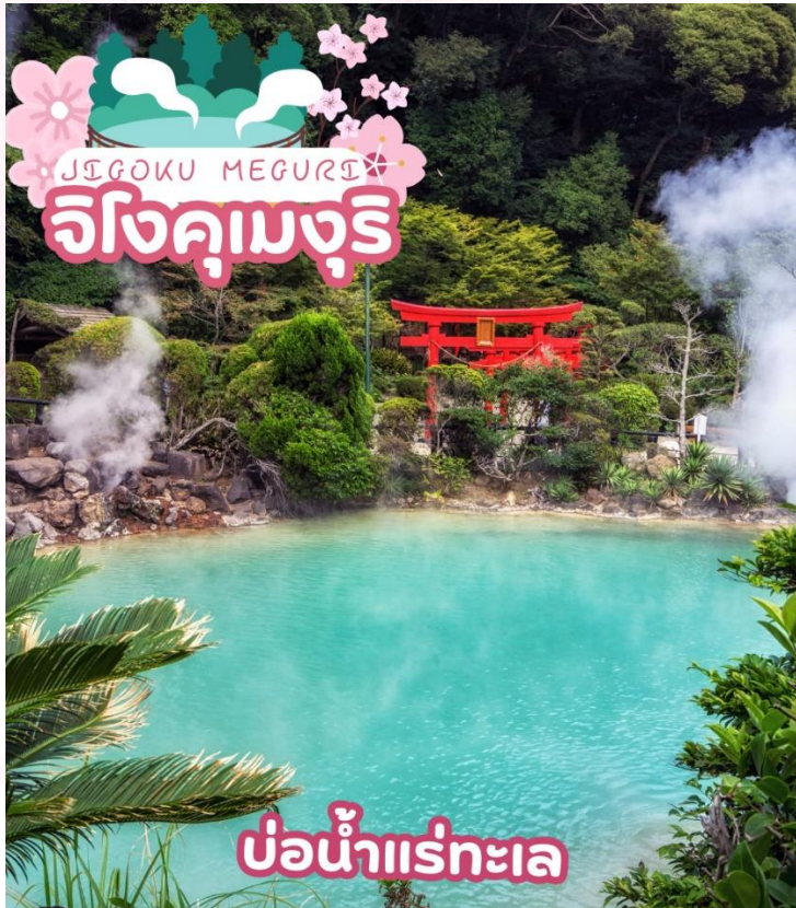
บ่อน้ำแร่ทะเล

หมู่บ้านยูฟูอิน (YUFUIN FLORAL VILLAGE) เป็นหมู่บ้านเล็กๆที่อยู่ในจังหวัดโออิตะห่างจากเมืองบ่อน้ำร้อนเบปปุประมาณ 10 กิโลเมตร หมู่บ้านแห่งนี้เป็นหมู่บ้านหัตถกรรม และยังเป็นทีรวบรวมแบบบ้านต่างๆในประเทศญี่ปุ่นที่มีอายุตั้งแต่ 120-180 ปีมารวมไว้ที่นี่อีกด้วย ที่นี่จึงจัดได้ว่าเป็นพิพิธภัณฑ์ที่มีชีวิตที่สามารถดึงดูดนักท่องเที่ยวให้เดินทางมาเยี่ยมชมได้ตลอดทั้งปี จากนั้นพบความงามของ ทะเลสาบคิริน (Kirin Lake) น้ำทะเลสาบใสเห็นตัวปลาแหวกว่ายในผืนน้ำ บางช่วงมีหมอกบางๆ ลงนับว่าคุ้มค่ากับการมาเห็นความงามนี้ด้วยตาตัวเองสักครั้งหนึ่งอย่างแน่นอน อีสระให้ท่านเดินเล่นและถ่ายรูปตามอัธยาศัย