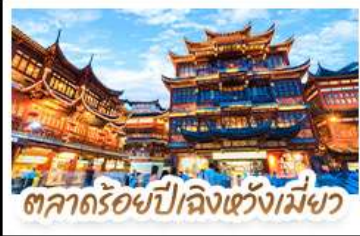
ตลาดร้อยปีลิ่งเซวี่เม่ฆา