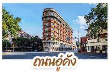
ถนนอู๋ดิง