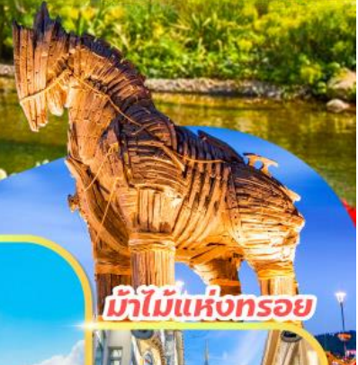
ม้าไม้แห่งทรอย