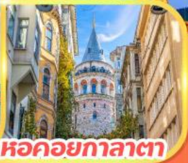
หอคอยกาลาตา

เดินทาง 06 - 15, 13-22 เม.ย.69 15 - 24 เม.ย.69