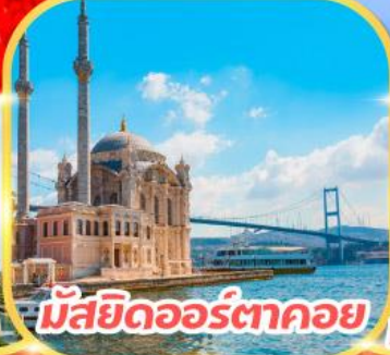
มัสยิดออร์ตาคอย