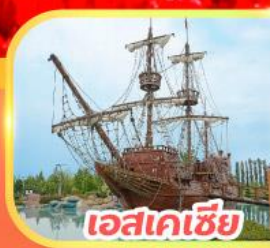
เอสเคเซีย