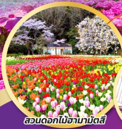
สวนดอกไม้ฮามามัตสึ