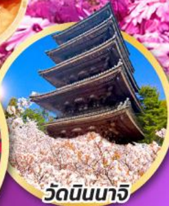
วัดนินนาริ