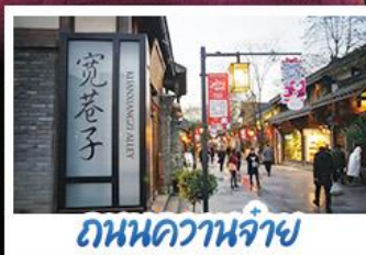
ถนนความจำ