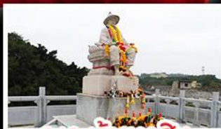
พระเจ้าตากสิน