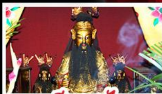
เซียงบูชัว