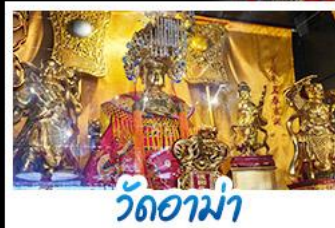
วัดอาเมา