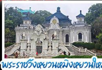
พระราชวังเซวานเหมิงเซวานเหมิง