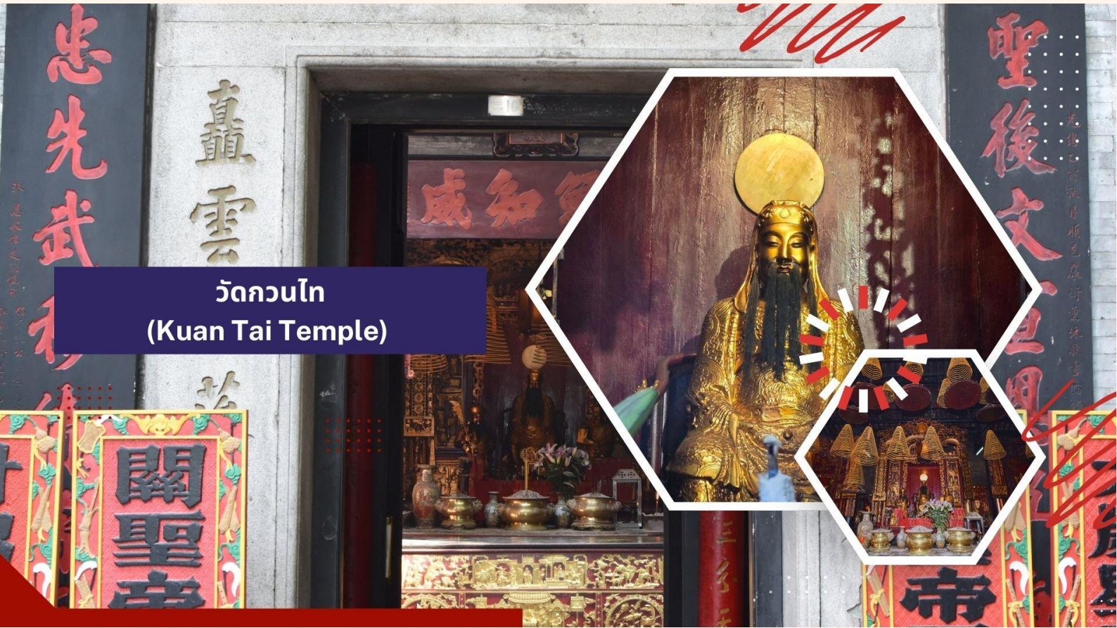
วัดกวนไท (Kuan Tai Temple)

เซนต์ปอลสร้างขึ้นในปี ค.ศ. 1580 แต่ถูกทำลายถึงสองครั้ง ในปี ค.ศ.1595 และ ค.ศ.1601 ตามลำดับ จนกระทั่งเกิดเพลิงไหม้ในปี ค.ศ. 1835 ทั้งวิทยาลัย และโบสถ์ถูกทำลายจนเหลือแต่ด้านหน้าของตึกฐานโบสถ์ส่วนใหญ่และบันไดด้านหน้าของตึกแสดงให้เห็นถึงสไตล์ผสมระหว่างตะวันออกและตะวันตกและมีอยู่ที่นี่เพียงแห่งเดียวเท่านั้นในโลก