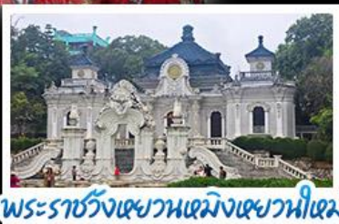
พระราชวังเซวานเหมิงเซวานใหม่