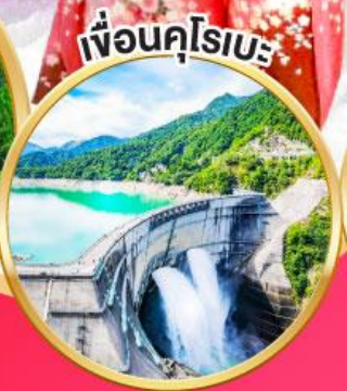
เพื่อนคูโรเบะ