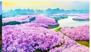
ชากระะผิงป่า

*ทางบริษัทฯ ขอสงวนสิทธิ์ในการสลับโปรแกรมทัวร์ตามความเหมาะสมขึ้นอยู่กับสถานการณ์หน้างาน โดยคำนึงถึงผลประโยชน์ของลูกค้าเป็นสำคัญ