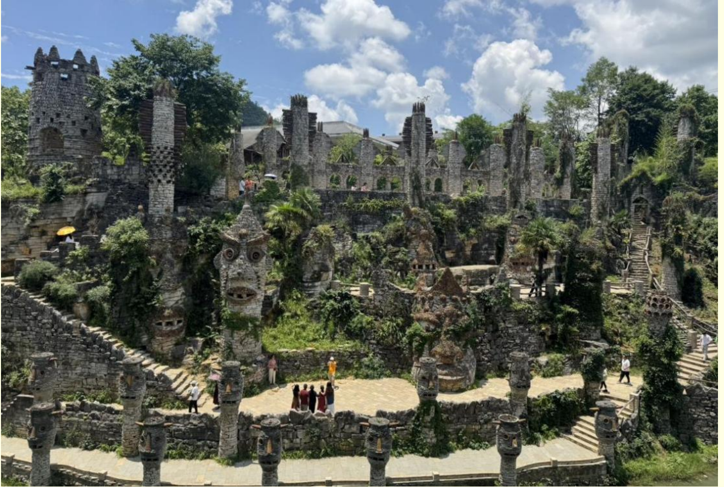
วิญญานที่ชั่วร้ายออกไป

นำท่านไป ปราสาทหินเย่หลางกู่ ในหมู่บ้านเล่อผิง ย่านหัวซี มณฑลกุ้ยหยาง เป็นปราสาทหินที่มี รูปปั้นหินมากกว่า 300 รูปวางเรียงรายอยู่รอบสองฝั่งของลำธารรูปปั้นเหล่านี้ดูคล้ายกับรูปปั้น มนุษย์ขนาดใหญ่บนเกาะอีสเตอร์ ในประเทศชิลี รูปปั้นเหล่านี้โดยได้รับแรงบันดาลใจมาจากจิ๋วห นั้ว จี๋วจากทางตอนใต้ของจีน ที่ผู้คนจะดำเนินการแสดงโดยสวมใส่หน้ากากและเต้นรำ เพื่อขับไล่