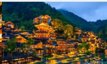
หมู่บ้านโบราณวูเจียงจ้าย