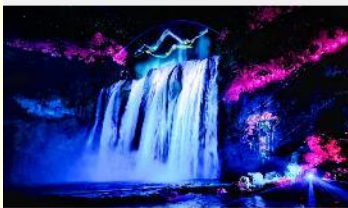
อุทยานน้ำตกหวงกั๋วซู่