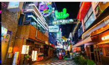
ถนนคนเดินซิงหยุน