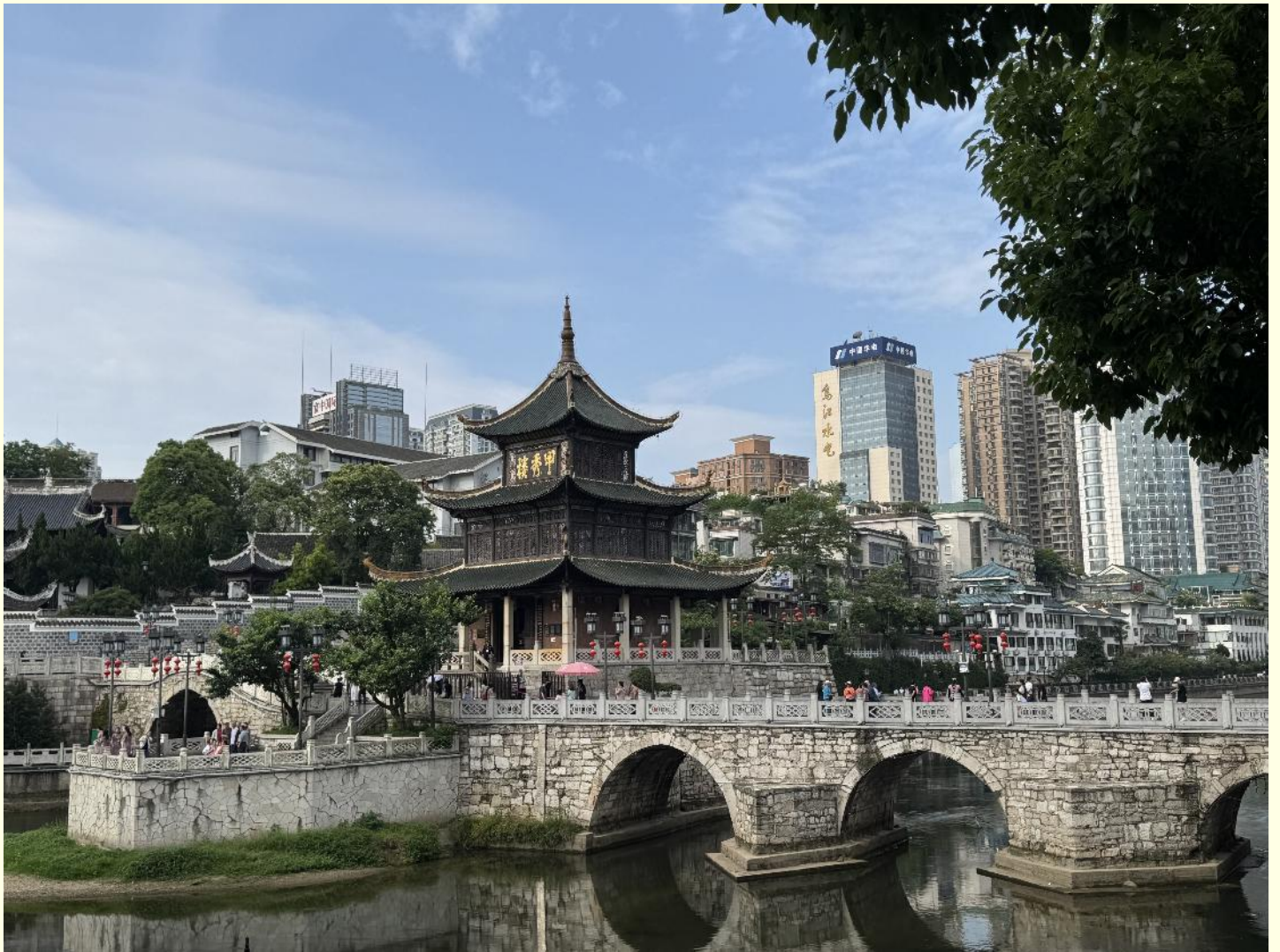
ศิลปวัฒนธรรมสำคัญแห่งชาติ

จากนั้นนำท่านสู่ หอเจี๋ยเซี่ยวโหลว สถานที่ท่องเที่ยวระดับ 3A ของประเทศจีน ถูกสร้างขึ้นในสมัยราชวงศ์หมิง เจี๋ยเซี่ยวโหลวที่เห็นกันอยู่ในปัจจุบันเป็นหอที่สร้างขึ้นมาใหม่ในปีจักรพรรดิซวนถ่ง (ผู่อี๋) ค.ศ.1909 จากพื้นสะพานจนถึงยอดหลังคาหอ มีความสูงประมาณ 20 เมตร หอมีทั้งหมด 3 ชั้น และในปี 2006 ทางคณะรัฐมนตรีได้ประกาศให้หอเจี๋ยเซี่ยวโหลวเป็น "สถานที่อนุรักษ์"