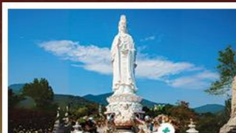
วัดเจลิอัน