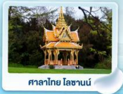
ศาลาไทย ไชยานันท์

พิเศษสุดๆ สองเงาเง่าหัวใจ กลาเซียร์ 3000 และ เซอร์แมท