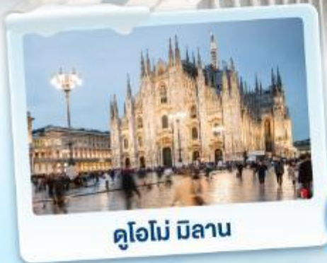
คูโอโม มิลาโน