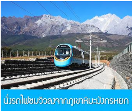
นั่งรถไฟชมวิวจากภูเขาหิมะมังกรหยก

***โปรดทราบ การแสดงนี้จัดขึ้นบริเวณลานกลางแจ้ง หากมีการงดการแสดงในวันนั้นๆ ไม่ว่าจะด้วยสภาพอากาศหรือกรณีอื่นใด ทำให้ไม่สามารถชมการแสดงได้ ผู้จัดสามารถจัดโชว์พื้นเมืองชุดอื่นมาทดแทนให้ท่านั้น โดยไม่มีการคืนค่าบริการใดๆ ทั้งสิ้น ***