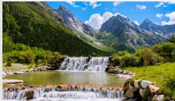
อุทยานแห่งชาติปี่เฟิงโกว