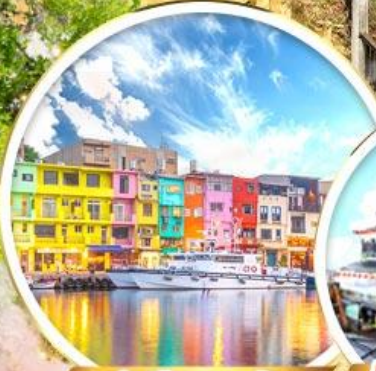
ท่าเรือสายรุ้ง