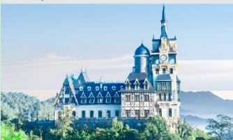
ปราสาทตามด้าว