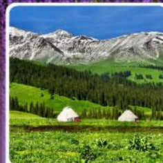
ทุ่งหญ้านาลาติ