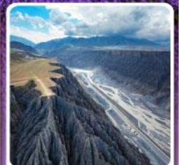
แกรนด์แคนยอนคู่ซานจื่อ