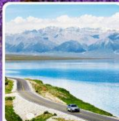
ทะเลสาบไซไห่หลี่มู่