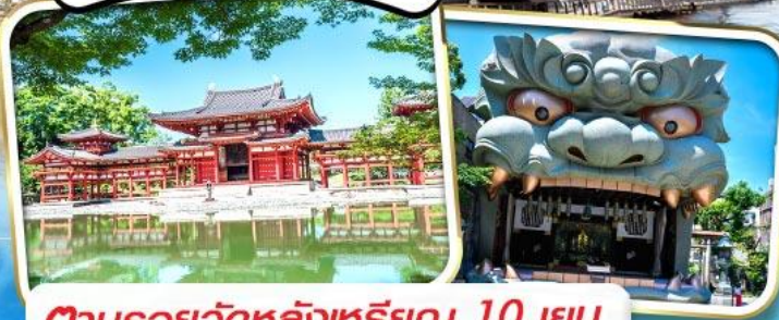
ตามรอยวัดหลังเหรียญ 10 เยน

รวม ค่าภาษีที่ปรับขึ้นแล้ว (ประกาศ 1 เม.ย. 69)