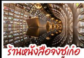
ร้านหนังสือจงซูเก๋

ภูเขาซีดรูณี - อุทยานป่ฝิงโกว - รูปปั้นหมีแพนด้า นอนเซลฟี ร้านหนังสือจงซูเก๋ - วัดต้าฉือ - ถนนโบราณชอยกว้างชอยแคบ เมบูพิเศษ สุกี้หมาล่าเสฉวน