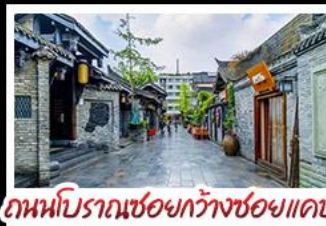
ถนนโบราณชอยกว้างชอยแคบ