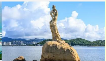
จูไห่ฟิชเชอร์เกิร์ล(หวีหนี่)

*ทางบริษัทฯ ขอสงวนสิทธิ์ในการสลับโปรแกรมทัวร์ตามความเหมาะสมขึ้นอยู่กับสถานการณ์หน้างาน โดยคำนึงถึงผลประโยชน์ของลูกค้าเป็นสำคัญ