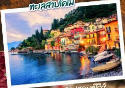
ตามร่องซีรีส์