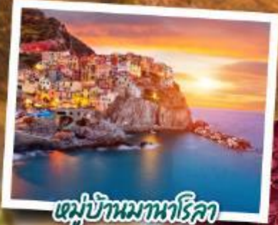
หมู่บ้านมานาโรลา