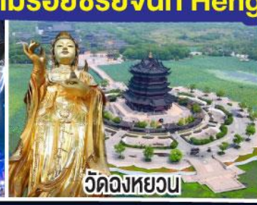
วัดฉงหยวน