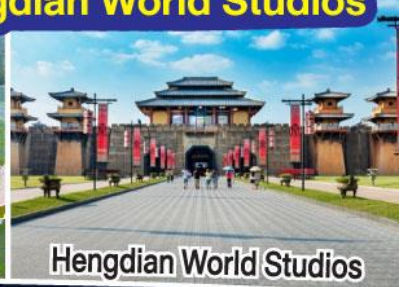
Hengdian World Studios