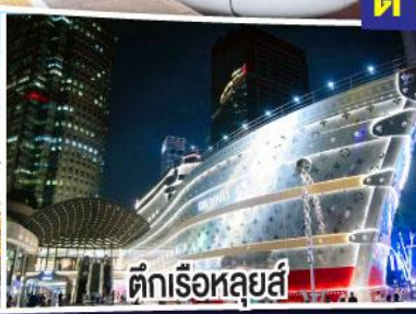
ตึกเรือหุหลู่