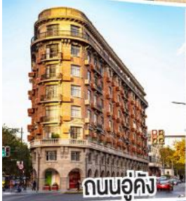
ถนนอู่คัง

ตามรอยซีรีส์จีนที่ Hengdian World Studios