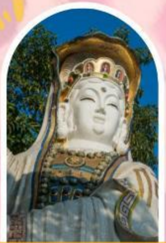
รีพลัสเบย์ รับพลังงานดี เสริมพลังดวงจัญ