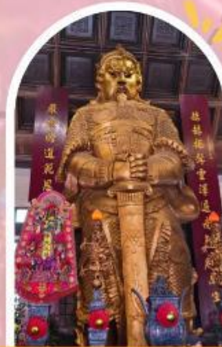
วัดแซกง ขอพรโชคลาก การเงิน และธุรกิจ