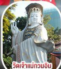
วัดเจ้าแม่กวนอิม รีพัลส์เบย์