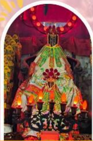
วัดเจ้าแม่กวนอิมอ่องฮำ ขอพรเรื่องเงิน ทรัพย์สิน และความมั่งคั่ง