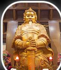
วัดเขangkงมี้ว