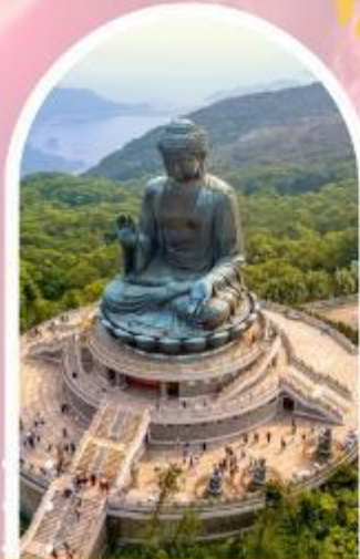
นั่งกระเชานองปิง นมัสการพระใหญ่ไป่หวลัน