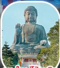
พระใหญ่ไ้่วหลิน