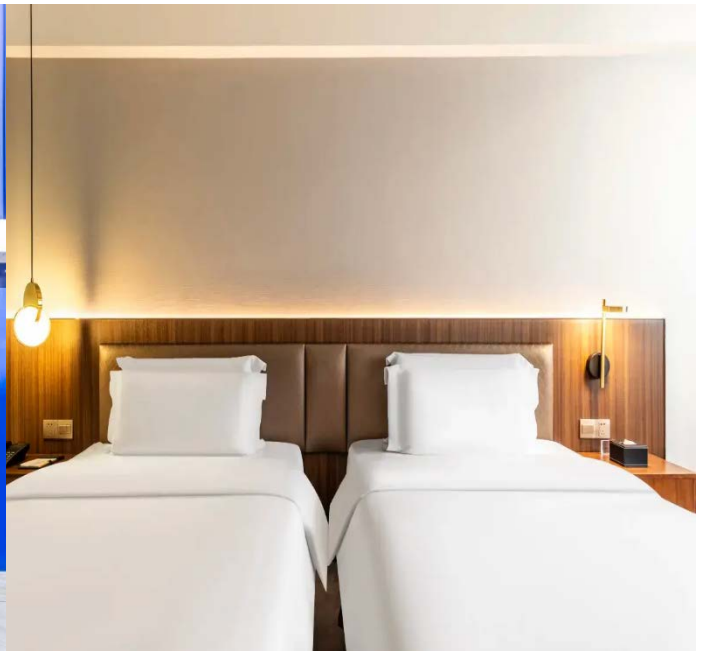
โรงแรมใจกลางย่านช้อปปิ้งชุนซีลู่