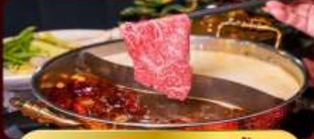
ชาบูหม่าล่าไม้อัน