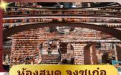
ห้องสมุด จงซูเก๋อ