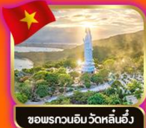
ขอพรกวนอิม วัดหลี่น้อ