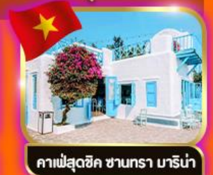
คาเฟ่สุดชิค ซานทรา มาริน่า