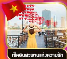
เช็กอินสะพานแห่งความรัก