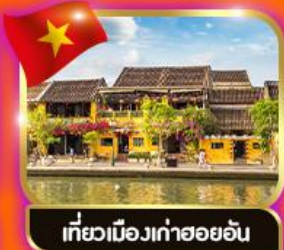
เที่ยวเมืองเก่าฮอยอัน