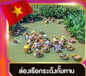
ล่องเรือกระดิ่งกัมทาน