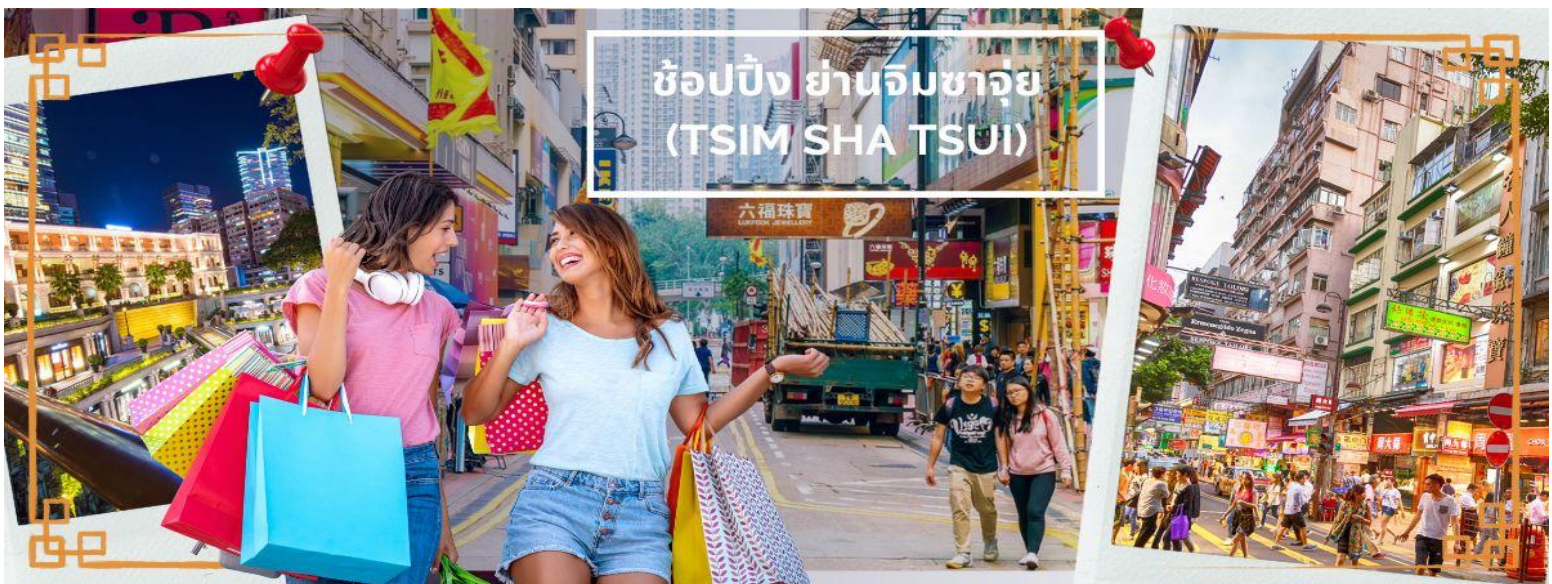
ช้อปปิ้ง ย่านจิมซาจ๋วย (TSIM SHA TSUI)

จากนั้นนำทุกท่านเดินทางสู่แหล่งช้อปปิ้ง ย่านจิมซาจ๋วย (TSIM SHA TSUI) สัมผัสกับบรรยากาศร้านเสื้อผ้า ร้านอาหาร และร้านขายเครื่องประดับที่แข่งกันเรียกลูกค้าตลอดแนวถนนที่มีทั้งสินค้าหรูหราและอุปกรณ์อิเล็กทรอนิกส์ ตั้งอยู่บนถนนนาธาน ถนนทอดยาวตั้งแต่ จิมซาจ๋วย จนถึงย่าน ปรีนซ์เอ็ดเวิร์ด เต็มไปด้วยร้านค้าต่างๆ มากมายทั้งเสื้อผ้าแบรนด์เนมระดับ HI-END ชื่อดังทั่วโลก ห้างสรรพสินค้าที่ทันสมัย จากถนนนาธานไปที่ถนนแคนตัน ท่านจะตื่นตาตื่นใจไปกับเอาต์เล็ตแบรนด์ที่เรียงติดกันเป็นแถบ นอกจากนี้ยังมี HARBOUR CITY ศูนย์การค้ายักษ์ใหญ่ของฮ่องกง ซึ่งมีร้านค้ากว่า 450 ร้านรวมอยู่ที่นี่ และมี SHOPPING COMPLEX ขนาดใหญ่ชื่อ OCEAN TERMINAL ซึ่งประกอบไปด้วยห้างสรรพสินค้าเรียงรายกันอยู่ และมีทางเชื่อมติดต่อกันสามารถเดินทะลุถึงกันได้ให้แบรนด์ดังมากมายให้ท่านได้เลือกซื้อ ไม่ว่าจะเป็น COACH, LONGCHAMP, LOUIS VUITTON, HERMES, PRADA, GIORDANO, BOSSINI และอีกมากมาย ทางด้านตะวันออก จะมีบาร์และร้านอาหารริมน้ำจำนวนมากให้ท่านได้ผ่อนคลายหลังจากการเดินช้อปปิ้ง ให้พักจิบกาแฟหรือรับประทานอาหารมือเที่ยง ชมวิวของอ่าววิกตอเรีย เดินเล่นบริเวณใกล้ๆ จิมซาจ๋วยเริ่มต้นจากหอนาฬิกาสมัยอาณานิคม แลวนี่มีทัศนียภาพที่สวยงามที่สุดแห่งหนึ่งสำหรับการชมวิวตามแนวท่าเรือของเกาะฮ่องกง จิมซาจ๋วยยังอยู่ใกล้กับพิพิธภัณฑ์และแหล่งท่องเที่ยวทางวัฒนธรรมของฮ่องกง อย่างเช่น พิพิธภัณฑ์อวกาศและพิพิธภัณฑ์ศิลปะ เป็นตัวเลือกให้ท่านไปเยี่ยมชมได้อีกด้วย