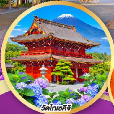
วัดโทเซคิจิ