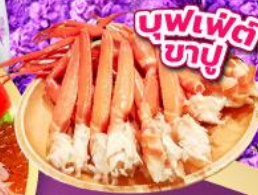
บุฟเฟ่ต์ ขาปู