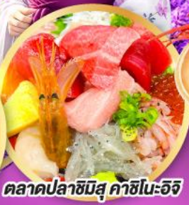
ตลาดปลาฮิมสุ คาชิโนะอิชิ