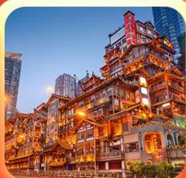
“ล่องเรือชมฉงชิ่งหงหยาดัง”