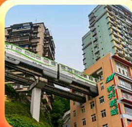
“นึ่งรถไฟทะลุคิก”

T2G-CKG25FD บินตรงลงชิง...ต้าจู้ อุ่หลง อุทยานหลุมฟ้า เขานางฟ้า 5D 4N (FD)