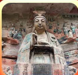
“ผาหินแกะสลักต้าจู้”