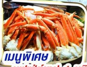
เมนูพิเศษ บุฟเฟ่ต์ชาปู 1 ชนิด