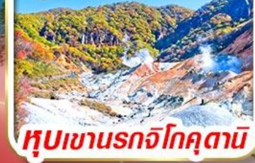
หุบเขานรกจิกุคุตามิ

รวม ค่าภาษีที่ปรับขึ้นแล้ว (ประกาศ 1 เม.ย. 69)