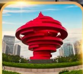
จตุรัสห้าสี