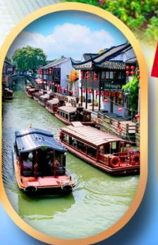
ถนนชานกิ่งเจีย