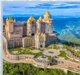
ปราสาทจันทร