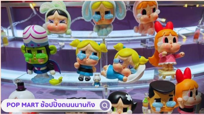
POP MART ซ้อป๊ิงถนนนานกิง