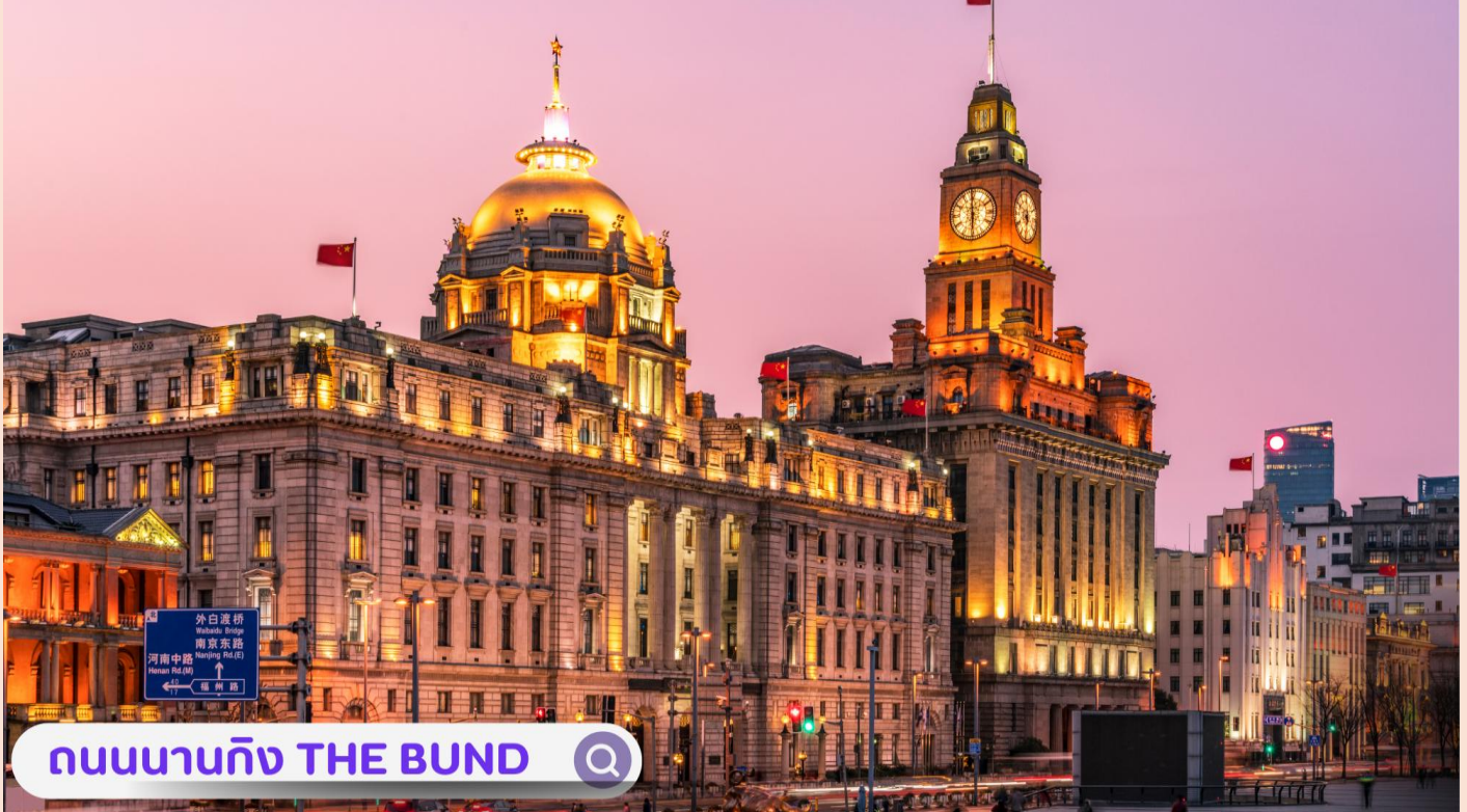
ถนนนานกิง THE BUND

จากนั้นอิสระท่านเฟลิดเฟลินที่ ถนนนานจิง(NANJING ROAD) เป็นย่านช้อปปิ้งเก่าแก่ที่สุดของเซี่ยงไฮ้ เป็นตลาดซื้อขายของกันคึกคักตั้งแต่ทศวรรษ 1920 ตั้งอยู่ฝั่งผู้ซีกินพื้นที่ยาวตั้งแต่ฝั่งตะวันตกของ “เดอะ บันด์” ถึง “พีเพิลส์ สแควร์” เป็นแหล่งช้อปปิ้งสินค้าแบรนด์เนมจากทั่วโลก และยังเป็นศูนย์รวมร้านค้าและร้านอาหารอีกมากมาย และพลาดไม่ได้กับนักจุ่มอาร์ทหายอย่าง แบรินด์ POPMART GLOBAL FLAGSHIP STORE ร้านขายของเล่นที่เป็นที่โด่งดังในขณะนี้ไม่ว่าจะ LABUBU MOLLY SKULLPANDA และอย่างอื่นอีกมากมาย ให้ท่านได้เลือกลุ้นกับอย่างสนุกสนาน