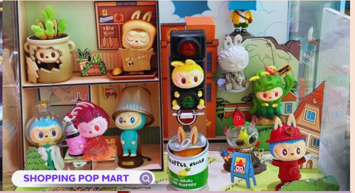
SHOPPING POP MART